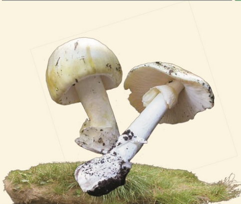
MUCHOMOR SROMOTNIKOWY (ZIELONY)