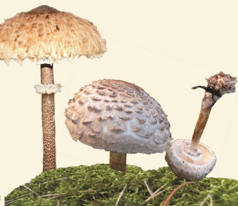
CZUBAJKA KANIA "SOWA"