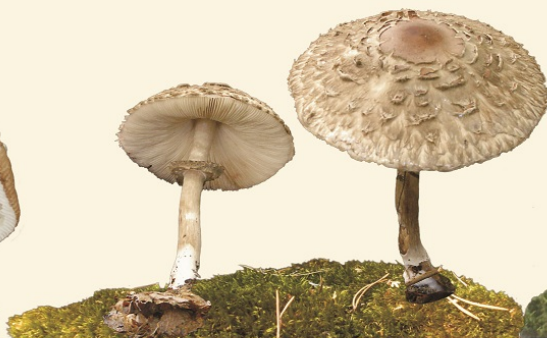
CZUBAJKA KANIA "SOWA"