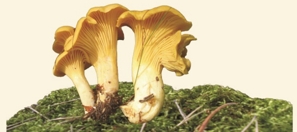
PIEPRZNIK JADALNY "KURKA"