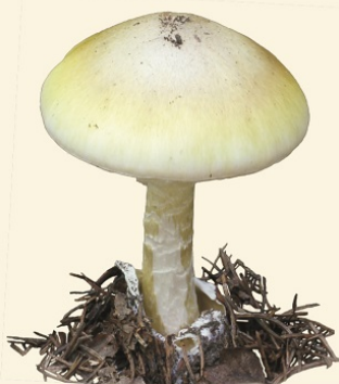
MUCHOMOR SROMOTNIKOWY (ZIELONY)

- grzyby powinno się wykrywać z podłoża, (a nie ścinać nożem), co ułatwia identyfikację, a jednocześnie zapobiega wysychaniu grzybnii