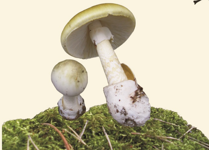
MUCHOMOR SROMOTNIKOWY (ZIELONY)

toksyny: AMANITYNA I FALLOIDYNA uszkadzają głównie narządy mięszone (nerki, wątroba) toksyny szybko wchłaniają się z przewodu pokarmowego (4-6 h) okres ujawnienia choroby : 8-12h lub 24h 25g grzyba może stanowić już dawkę śmiertelną dla dorosłego człowieka zróżnicowane nasilenie objawów