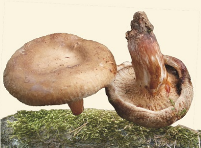
KROWIAK PODWIŃĘTY "OLSZÓWKA"

po 15 min. do 5 h, intensywne zaburzenia żołądkowo-jelitowe zlewne poty zwięźlenie źrenic zaburzenia akomodacji zwiększone wydzielanie żółci i soku trzustkowego zaburzenia krążenia zaburzenia oddychania spadek ciśnienia krwi zwolnienie akcji serca